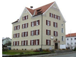
VG Ober- viechtach