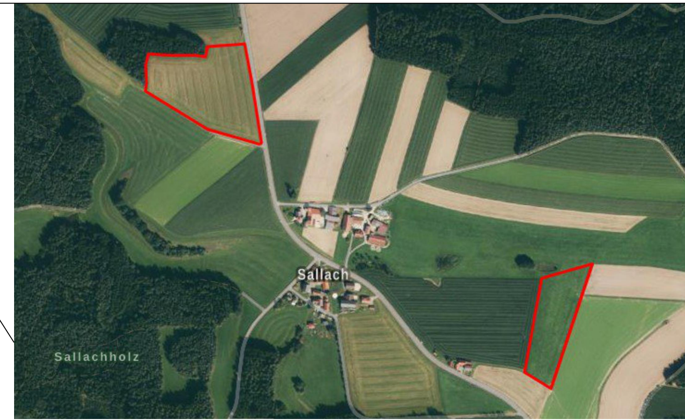
Lage PV-Anlage (links) und CEF-Maßnahme (rechts) ohne Maßstab