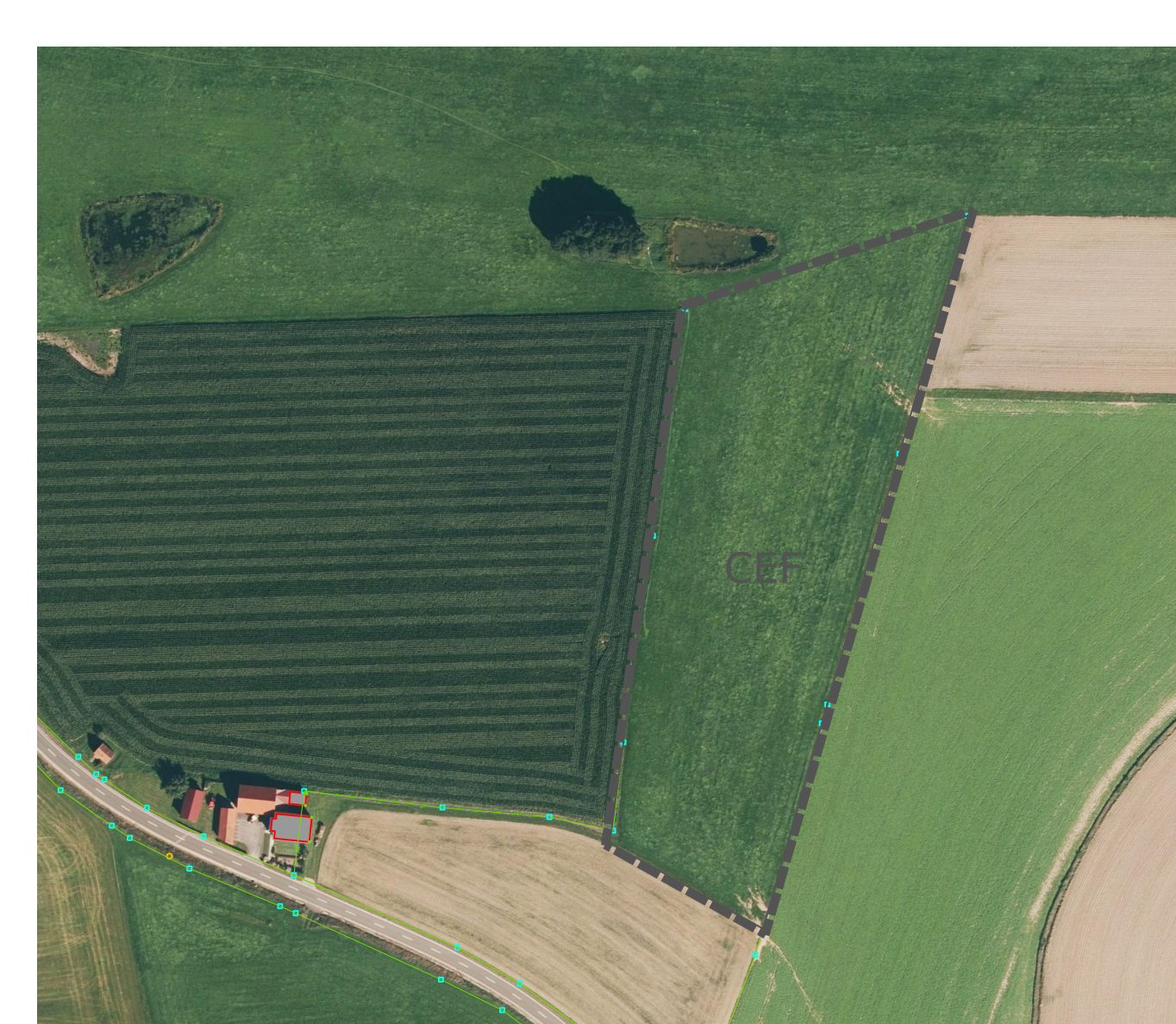
Lage CEF-Maßnahme: Flurstück Nr. 409 (TF), Gmkg. Wagnern (4828)