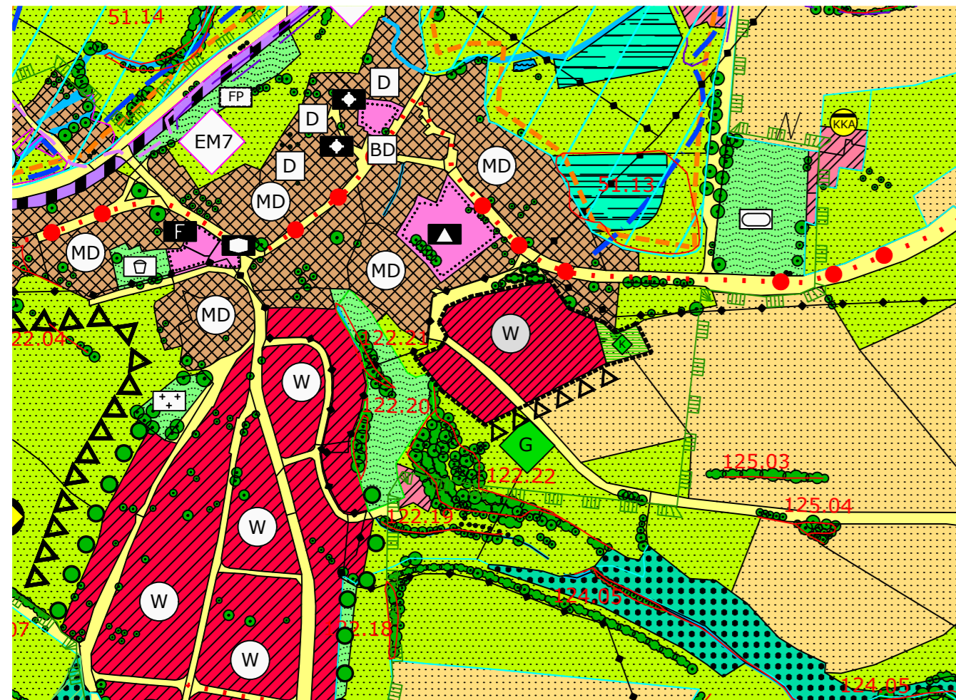
Änderung des Flächennutzungsplanes mit Stand vom 16.04.2026