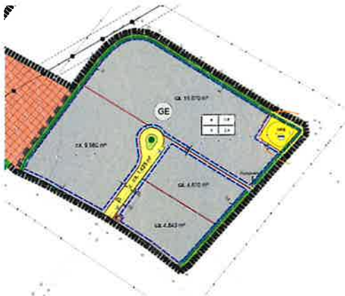
Geltungsbereich Bebauungsplan Gewerbegebiet

Der Geltungsbereich für den Bebauungs- und Grünordnungsplan umfasst das Flurstück 80 der Gemarkung Rottendorf mit einer Fläche von rd. 3,8 ha. Auf dem Flurstück 958 der Gemarkung Rottendorf wird zudem eine externe Kompensationsfläche angelegt. Der Geltungsbereich sowie die externe Kompensationsfläche können aus den nachfolgenden Bildern entnommen werden: