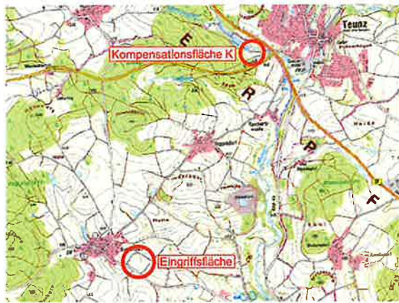
Übersichtslageplan Bebauungsplan u. externer Ausgleich