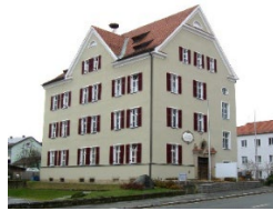
VG Ober- viechtach